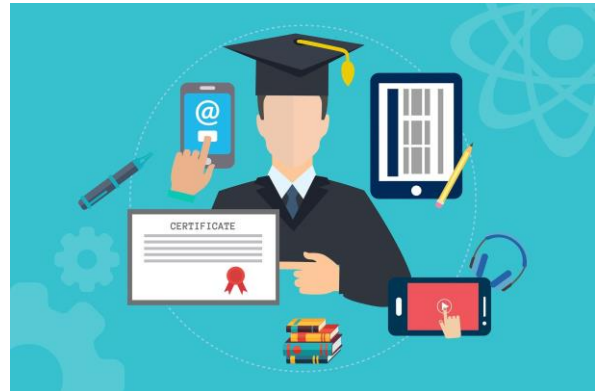
Aus- und Weiterbildungsmöglichkeiten über alle Kanäle